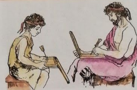
Výuka čtení a psaní.

Vidíte, že cíle naší výchovy nejsou nikterak malé.