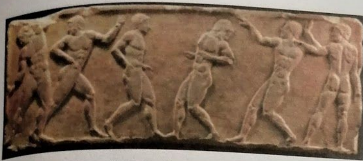
Sportovní motivy ze cvičení v palestre (reliéfy).